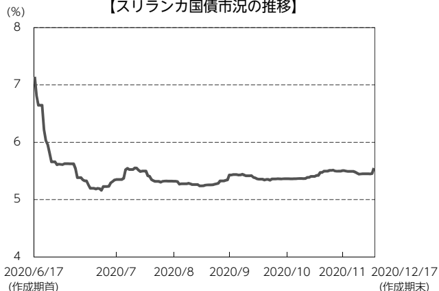
【スリランカ国債市況の推移】

※国債利回りは2年国債利回りを使用しています。