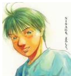
インデックスファンドに よろしく 4