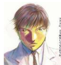
インデックスファンドに よろしく 5

※ EXE-i(エグゼアイ)は、一般社団法人投資信託協会における分類ではインデックスファンドには分類されません。 『ブラックジャックによろしく』 佐藤秀峰 <漫画on web http://mangaonweb.com >