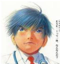
インデックスファンドに よろしく 1