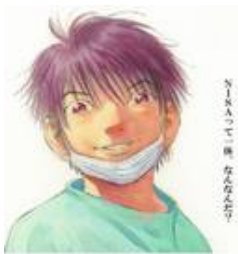
インデックスファンドに よろしく 2改