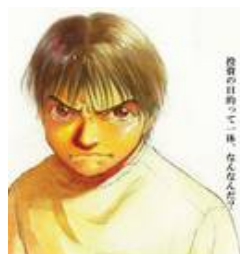
インデックスファンドに よろしく 3