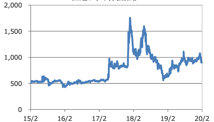
(円) 直近5年の株価推移

【データ期間】2015年2月12日～2020年2月12日まで