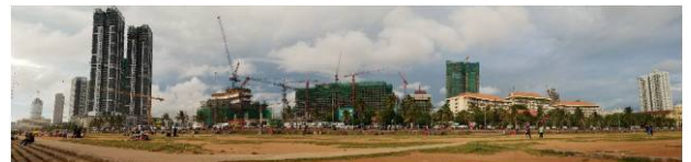
建設プロジェクトが進むスリランカの首都コロンボ