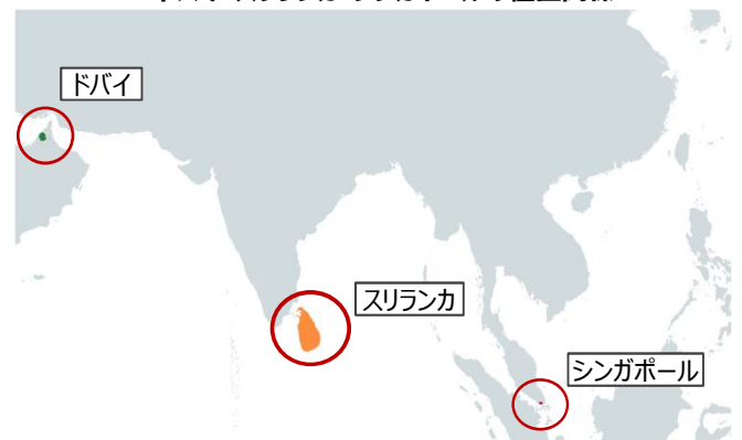
ドバイ・スリランカ・シンガポールの位置関係